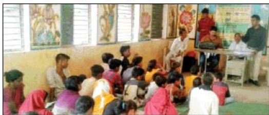
जांजगीर-चांपा। ग्रामीण व बच्चों को दी गई जानकारी।