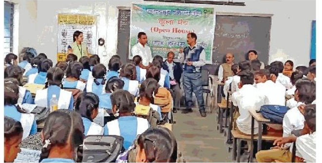
जांजगीर-चांपा। छात्र-छात्राओं को जानकारी देते टीम के सदस्य ● नईदुनिया

जांजगीर-चांपा (नईदुनिया न्यूज)। शासकीय उमा विद्यालय भोजपुर चांपा में हेल्प एंड हेल्पस समिति चाइल्ड लाइन 1098 द्वारा खुला मंच का आयोजन किया गया। जिसमें बच्चों को गुड टच वेड टच, पॉक्सो एक्ट, बालश्रम,