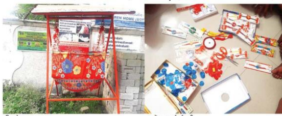
परिवार के बाहर लगा चलना

हुनर ■ नव्ही कोमल ऊंगलियों ने रेशमी धागे व मोतियों से गंदी सुंदर राखियां ■ परिवारियों के चलते परिवार से जुदा बच्चों ने भी पवित्र धैर्य के प्रतीक में सुजन के रंग ■ महाभारत कृतो: जंजगीर-चांपा