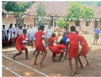
कबड्डी में रेंड करते खिलाड़ी।