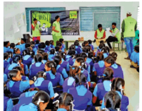
जांजगीर-चांपा। छात्रों को दी चाइल्ड लाइन की जानकारी।